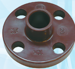
TS フランジ HT-PVC