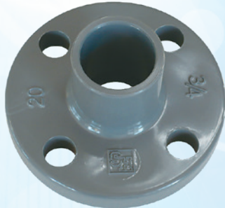
TS フランジ U-PVC