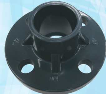
TS フランジ HI-PVC