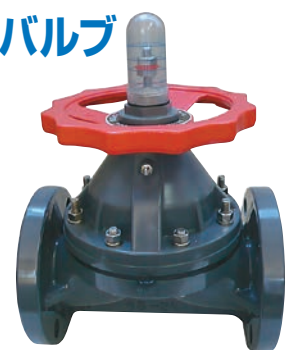
※写真はVP710 PP仕様は白色になります。