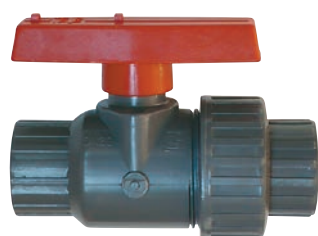
片自在ボールバルブ VP600 コンパクトボールバルブ VP911